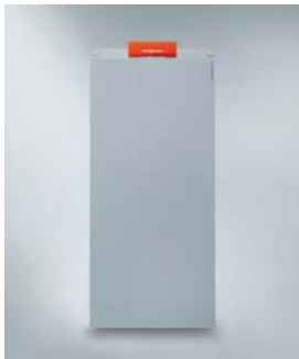
Vitocrossal 300 (CU3A)