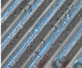
Inox-Crossal-Wärmetauscher aus Edelstahl

Spitzentechnik – diese Gas-Brennwertkessel lassen keine Wünsche offen.