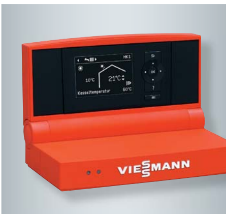
Vitotronic 200 Regelung mit übersichtlicher Menüführung