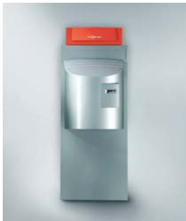
Vitocrossal 300 (CM3)