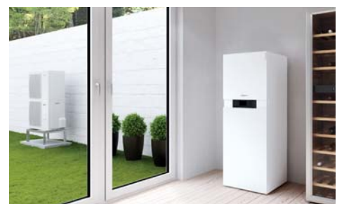
Inneneinheit Vitocaldens 222-F (links) mit weißer Außeneinheit (Typ 222.A29)

Hybrid Pro Control ermittelt diesen Zeitpunkt automatisch und reagiert entsprechend: Nach den aktuell eingegebenen Energiekosten für Strom und Gas wird errechnet, welcher Energieträger im Moment am effizientesten eingesetzt werden kann. Hybrid Pro Control hat immer das Gesamtsystem im Blick. Der integrierte Energiemanager ermittelt automatisch die effizienteste Betriebsart (Ökonomie oder Ökologie und Komfort).