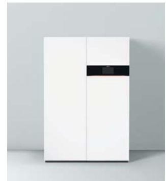
Designpreise für Vitotalor PT2