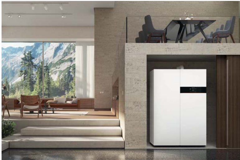
Brennstoffzellen-Heizgerät mit Spitzenlastkessel und Warmwasserspeicher

Mit der Brennstoffzelle durch eigene Stromerzeugung von steigenden Energiekosten unabhängig werden