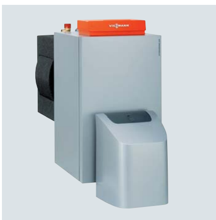
Vitorondens 200-T im Leistungsbereich von 67,6 bis 107,3 kW