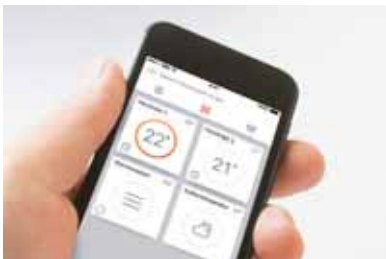
Mit Vitoconnect und einem Smartphone ist die Bedienung von Viessmann Heizungsanlagen ein Kinderspiel.