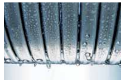
Inox-Radial-Wärmetauscher – langlebig und effizient

bundheizfläche wird die eingesetzte Energie praktisch verlustfrei und effizient bis zu 98 Prozent in Wärme umgewandelt. Dieser besonders sparsame Umgang mit wertvollem Heizöl hat auch weniger CO 2 -Emissionen zur Folge.