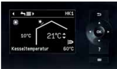
Display der Vitotronic Regelung mit Klartextanzeige und übersichtlicher Menüführung